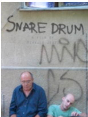
「snare drum」(フィクション、15分、2008年)