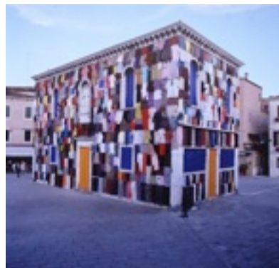
「The Dressed House」, 1999年 ベニスビエンナーレ