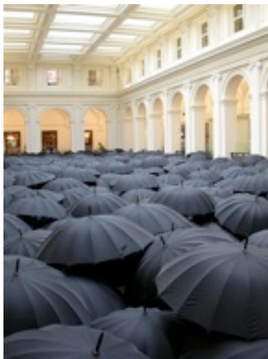
「Umbrellas」2005年 メルボルン、オーストラリア

今回滞在制作の中心となるのは、西法寺通り及び元町梅園通りのエリアです。アーティストは、地域住民や通りの歴史、文化と向き合いながら制作を進めます。