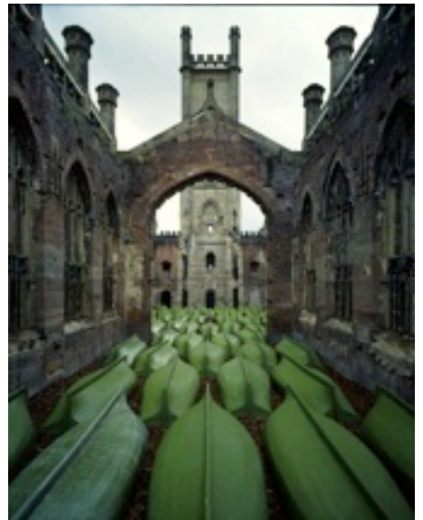
「56 ポート」, 2006年 リヴァプールビエンナーレ